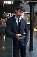
NEOBLU MARCEL MEN 03169